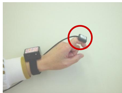
弊社8チャンネル小型無線モーションレコーダに外部センサとして接続した場面